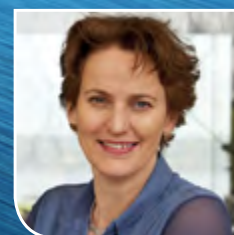
Francine Houben Nederlands architect met wereldsucces

RUIMTELIJKE ORDENING, HET KLIMAATAKKOORD, PUBLIEK-PRIVAAT SAMENWERKINGEN EN NIEUWE MOBILITEIT STAAN DEZE DAG CENTRAAL